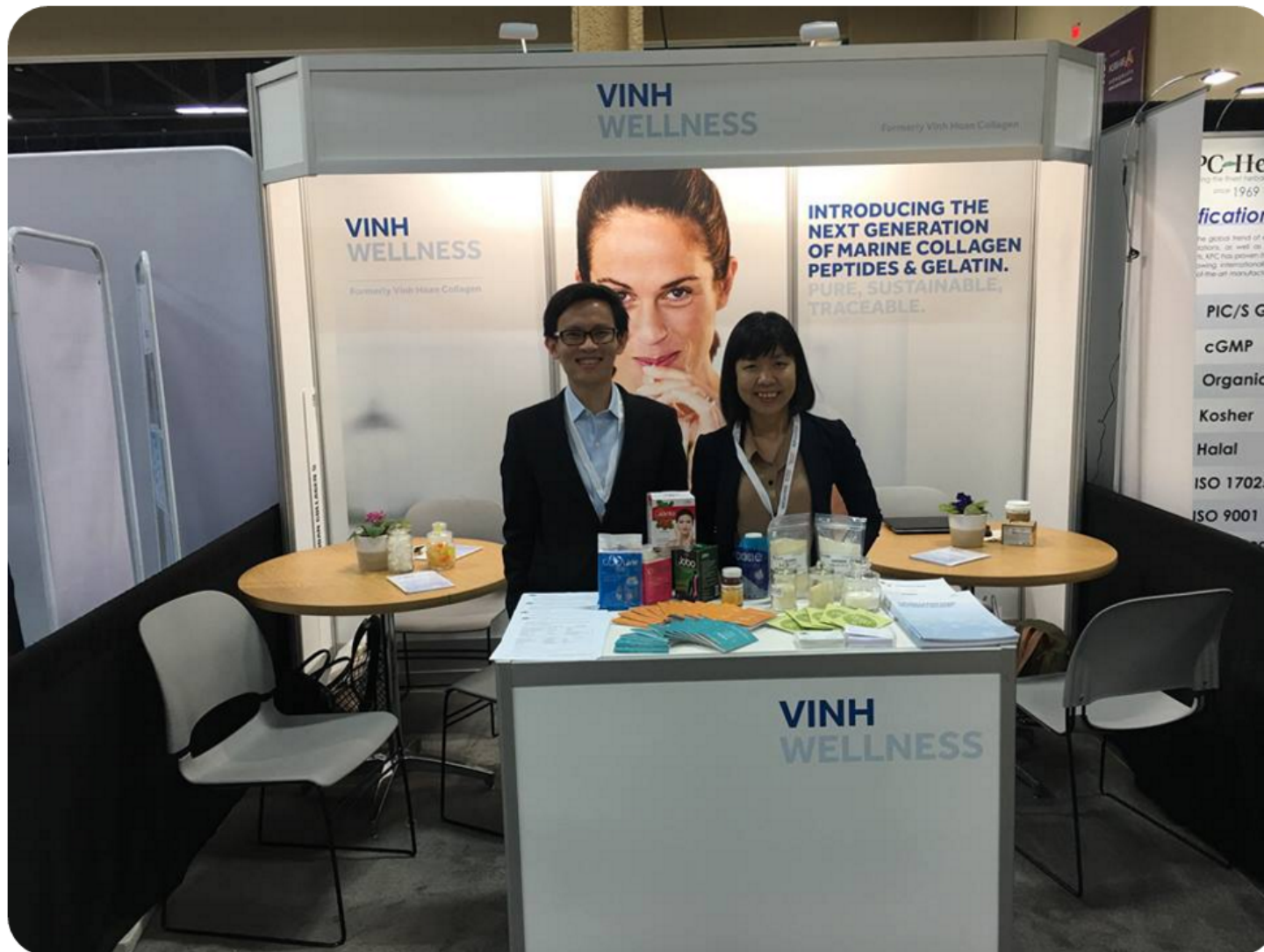
Gian hàng I109 của Vinh Wellness tại SSW2016

Vinh Wellness đã đem tới hội chợ Supply Side West năm nay các sản phẩm có nguồn gốc từ thủy sản nước ngọt với nguồn nguyên liệu đồng nhất và đạt chứng nhận Halal. Hội chợ Supply Side West là sự kiện hàng đầu thế giới về nguyên liệu và các giải pháp nguyên liệu, với sự tham dự của hơn 1,200 đơn vị triển lãm và hơn 10,000 nguyên liệu. Gian hàng I109 của Vinh Wellness đã nhận được sự quan tâm lớn của khách tham quan đối với sản phẩm collagen và gelatin chiết xuất từ da cá tra.