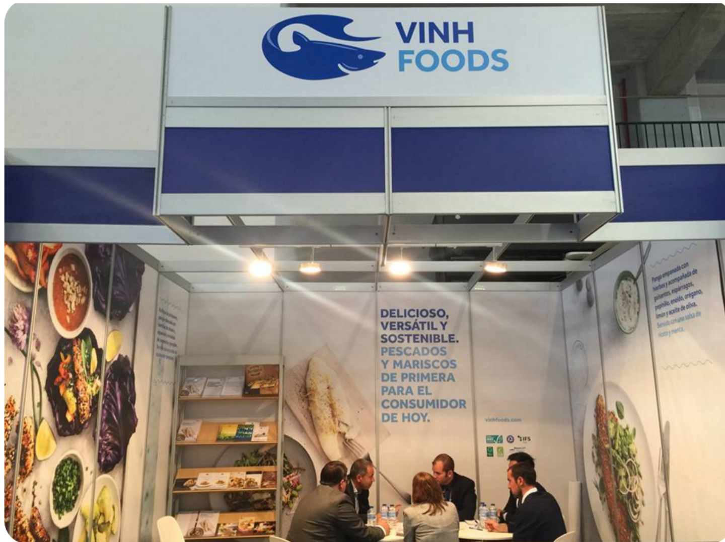
Vinh Hoan's booth H3 at Conxemar 2016