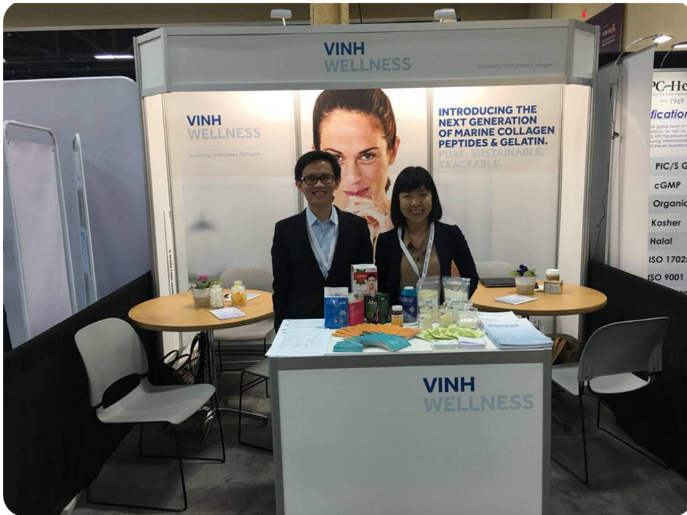
Vinh Wellness's booth I109 at SSW2016