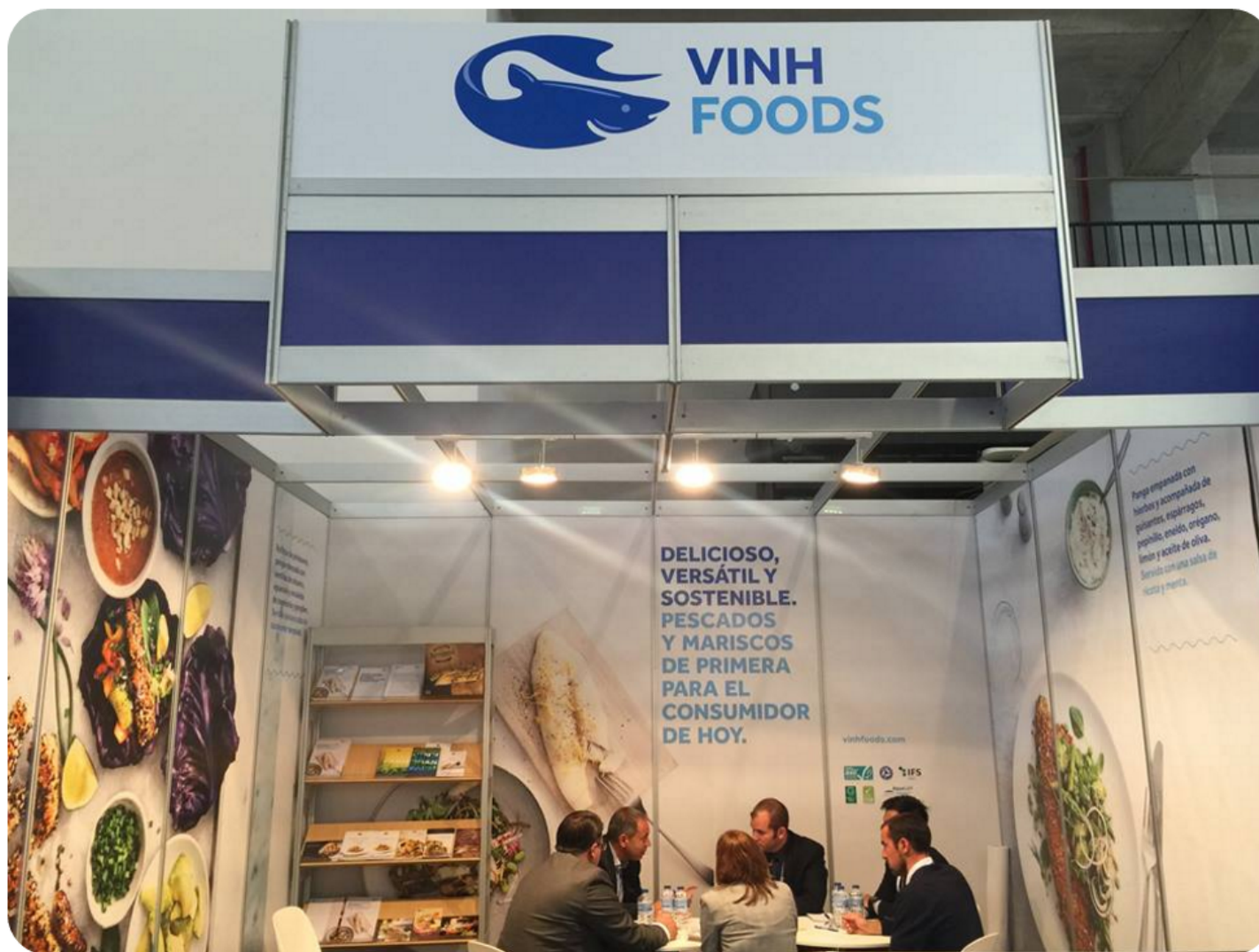
Gian hàng số H3 của Vinh Foods tại Conxemar 2016

Trong 3 ngày diễn ra hội chợ, gian hàng H3 của Vinh Foods đã tiếp đón hơn 200 lượt khách tham quan, trong đó khoảng 25% đã đặt hàng sau hội chợ.